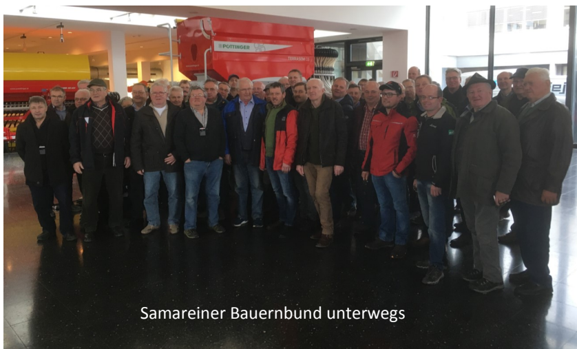
Samareiner Bauernbund unterwegs