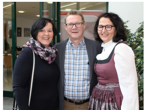
Die druckfrische Ausgabe des neuen Heimatbuches wurde am 16.12.2018 feierlich im Samareiner Gemeindezentrum präsentiert.